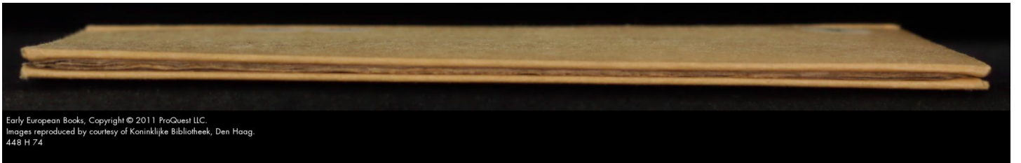
448 H 74